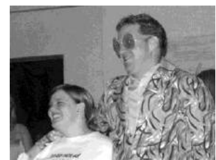
Elton (links) und Raab mal einer Meinung?