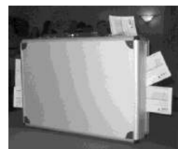
Der Koffer mit der Million...