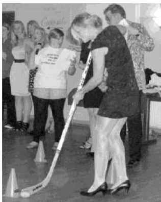
Slalom-Hockey auf Stöckel-Schuhen...