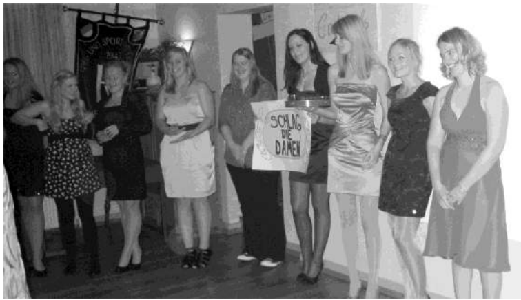
Schlag die Damen - gleich geht's los!