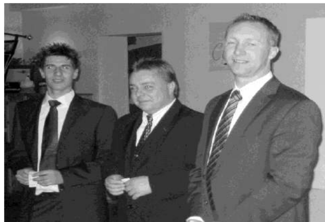
Die drei Gewinner der Verlosung